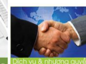
Dịch vụ & nhượng quyền thương mại