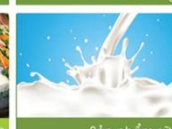
Sản phẩm sữa