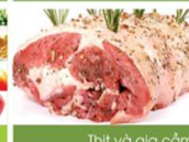
Thịt và gia cầm