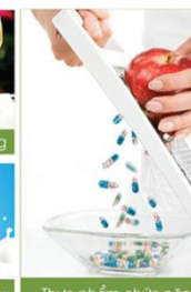
Thực phẩm chức năng