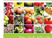
Rau quả, trái cây